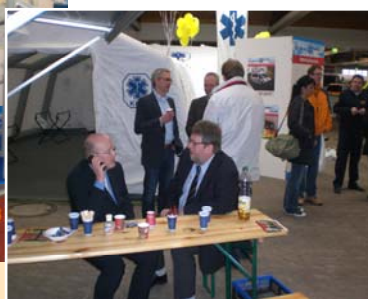
BKS Stand - Bundeskongress 2008