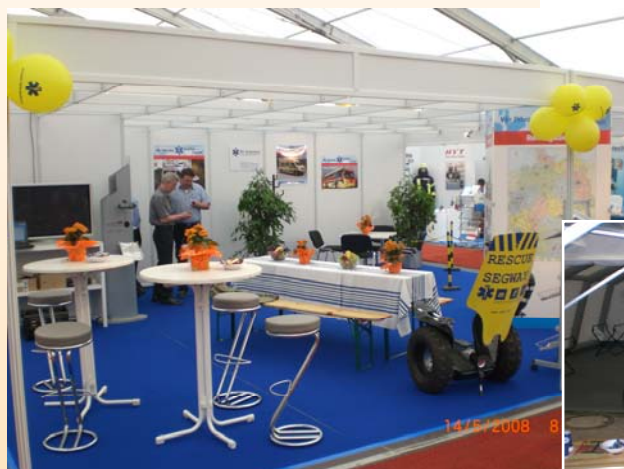
BKS Stand - Rettungsmobil 2008

Neben der Rettungsmobil war der BKS auch auf dem Bundeskongress vertreten und wird es im kommenden Jahr auch wieder sein. Wir freuen uns 2009 erneut auf den traditionellen Unternehmerabend im „Schwarzen Hahn“, viele interessante Gespräche und auf neue Besucher, welche eventuell bislang noch nicht den Weg zu uns gefunden haben.